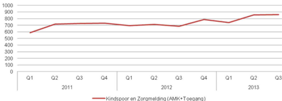
Figuur kindspoormeldingen 2011-2013

Bureau Jeugdzorg heeft de afgelopen jaren een stijging van het aantal meldingen van kindermishandeling ervaren. Dit is onder andere het gevolg van de aandacht die voor het signaleren van deze problematiek is gevraagd en de maatschappelijke wens hierop in te grijpen. Hierdoor zijn vooral de meldingen vanuit de beroepsgroepen zoals de politie (kindspoormeldingen) en medische beroepen gestegen. De stijging van kindspoormeldingen over de afgelopen jaren wordt in onderstaande grafiek zichtbaar gemaakt.